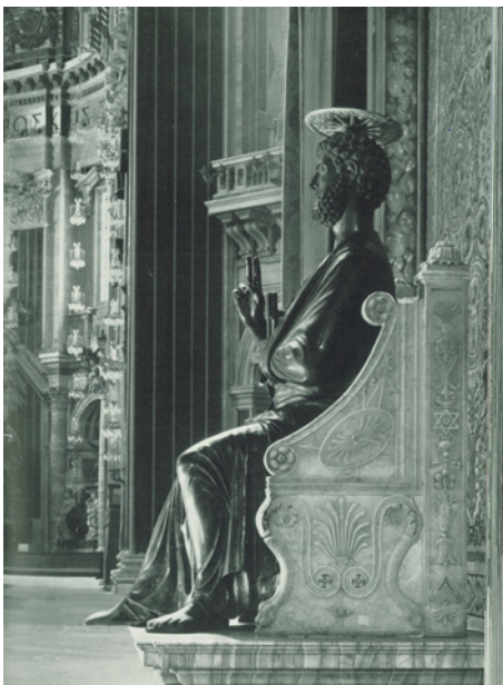
Spätantike Bronzestatue des hl. Petrus im Hauptschiff der Basilika von Mailand

Simon Petrus hat nach der Himmelfahrt Christi seine Funktion sofort wahrgenommen, sein Papsttum unverzüglich ausgeübt. Noch vor der Aussendung des Heiligen Geistes ergreift er die Initiative zur Ersetzung des Verräters Judas. Der hl.