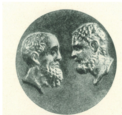
Petrus und Paulus auf einer Bronzemedaille, 2. Jh., gefunden in der Domitillakatakomben. Vat. Museum. Papstgeschichte von Xaver Seppelt