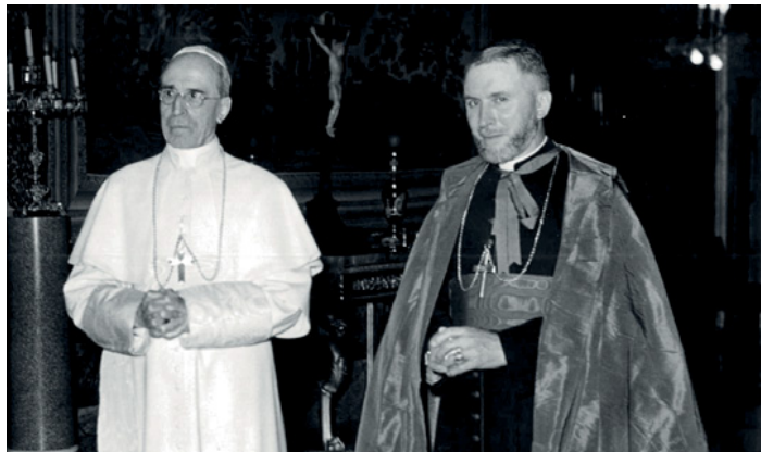
Zwischen Papst Pius XII. und Erzbischof Lefebvre bestand ein tiefes Vertrauensverhältnis.

Ja, diese Priester und ihre Bischöfe sind „Fundamentalisten“ im ursprünglichen Sinne, genauso wie ich und wie unser Herr Jesus Christus einer war: kompromißlos und keinen Schritt von der Wahrheit abweichend. Er stellt seine Apostel vor die Entscheidung: „Wollt auch ihr gehen?“ (Joh 6,67)